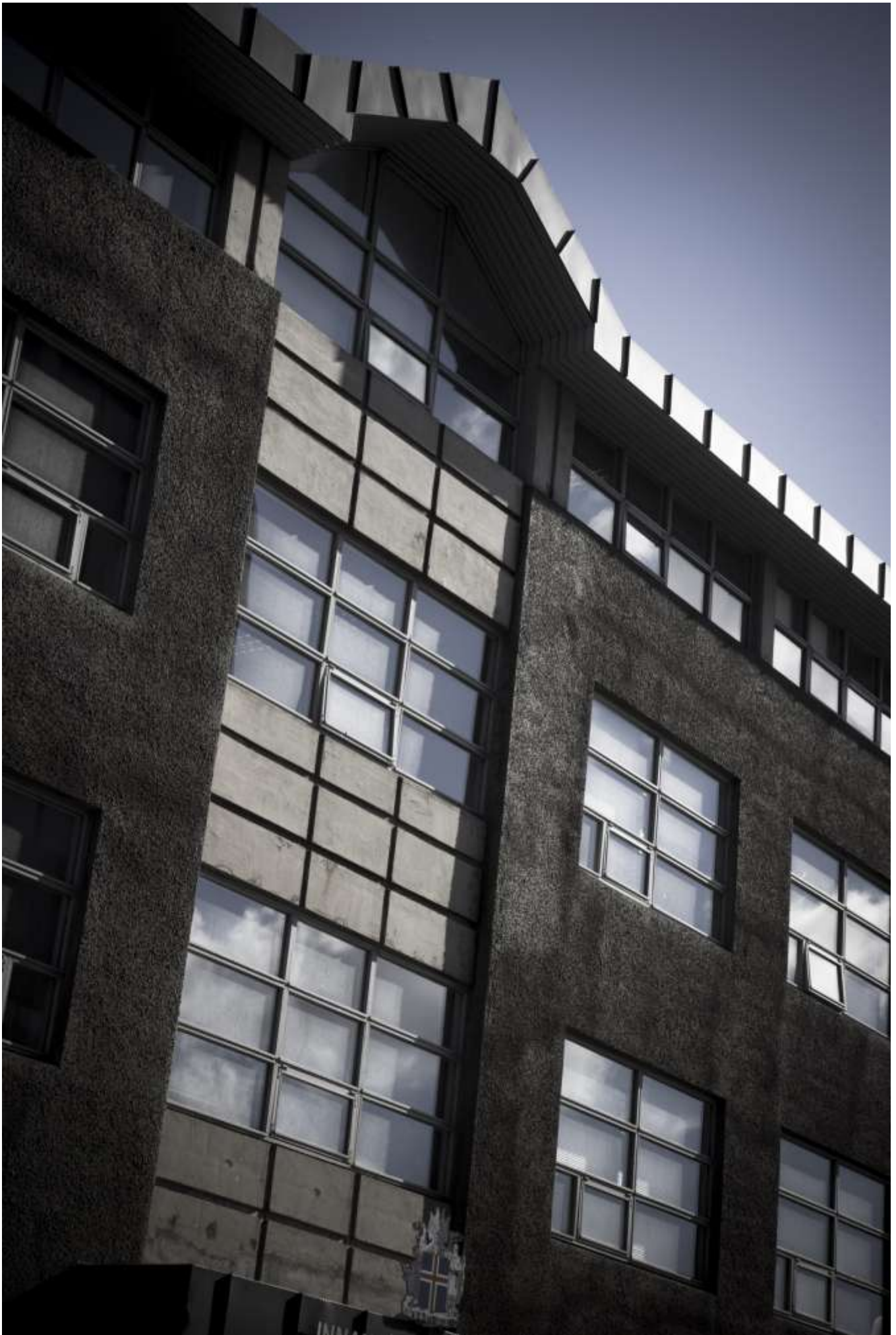
Sölvhólgata 7, 1990 - 2010